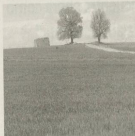
En el campo también se coloca el "Se vende" GARZARON

LOS EXPERTOS DETECTAN OFERTAS ATRACTIVAS PARA QUIENES TENGAN CONOCIMIENTOS AGRÍCOLAS PÁG. 7