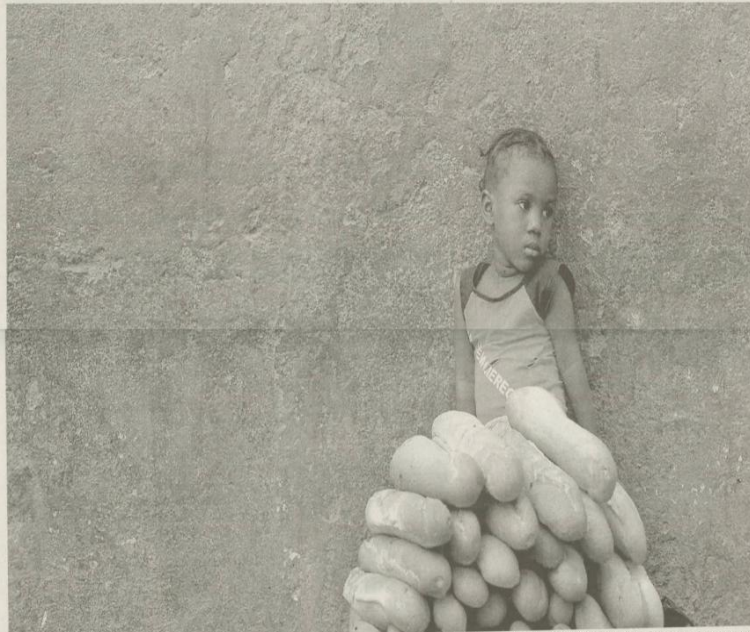
Varias iniciativas navarras se han asentado en Angola con la apertura al exterior derivada de la crisis. El año pasado el país angoleño se publicó en Baluarte